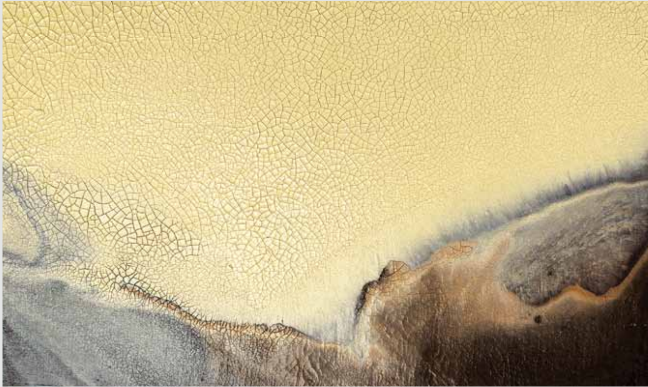
PAYSAGE SÉDIMENTAIRE - 2000 - 56 x 34 cm - 22 x 13,3 inch